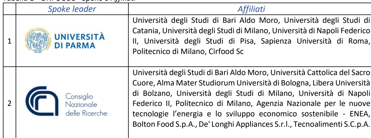
Tabella 1 - ONFOODS - Spoke e Affiliati